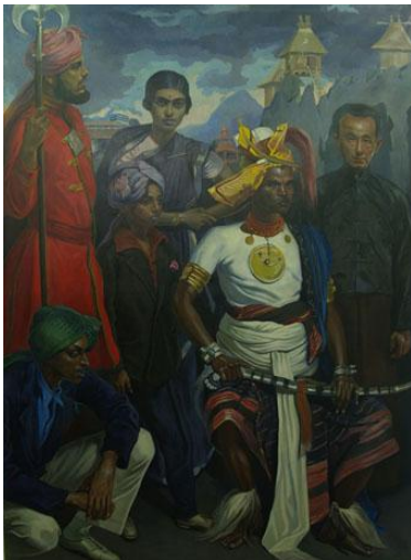
Eduardo Malta “Timor” (painel esquerdo) / “Timor” do tríptico comemorativo da Exposição Colonial Portuguesa, 1934, Porto óleo sobre tela 229 x 170 cm Casa- Museu Bissaya Barreto, Coimbra