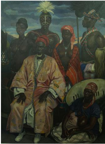
“Guiné” (painel direito) do tríptico comemorativo da Exposição Colonial Portuguesa, 1934, Porto óleo sobre tela 229 x 170 cm Casa- Museu Bissaya Barreto, Coimbra

Em 1934, no advento do regime do Estado Novo foi realizada a Exposição Colonial, no Palácio de Cristal no Porto. A exposição vinha reforçar, interna e externamente, a ideia histórica de nação colonizadora, que desde a Conferência de Berlim (1884-85) e o Ultimatum inglês de 1890 tinha sido fortemente abalada, arredando Portugal de muitas das suas pretensões territoriais coloniais. Reproduzindo o modelo de tantas outras exposições internacionais do género, o evento foi também celebrado artisticamente, sendo Eduardo Malta um dos seus mais significativos protagonistas. As duas telas laterais aqui expostas faziam parte de um tríptico, cujo painel central ficou inacabado e desaparecido, laudatório da missão colonizadora portuguesa. O próprio pintor foi generoso nas suas apreciações sobre a “arte” de pintar as “raças exóticas” em várias obras e várias ocasiões. Talvez um dos comentários mais significativos seja este: “Que gentes estranhíssimas nossos avós descobriram! Tantos portugueses de raças exquísitas... E cada raça com a sua completa harmonia de formas e de côr. Mistério envolvendo tudo, olhos que não olham como os nossos, raças apartadas, sorrisos inverosímeis, graça tão distante do nosso jeito de vê e de sentir que só quasi nas plantas, nos bichos, nos frutos e nas flores lhes encontramos semelhanças”. [E.T.]