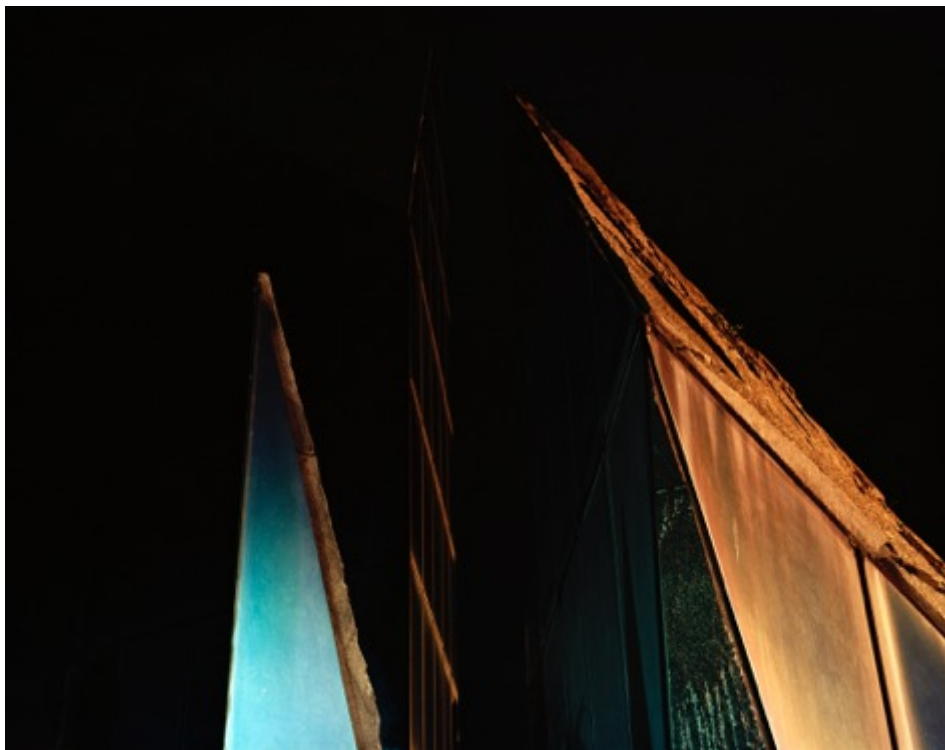
André Cepeda da série “Depois” sem título, Porto, 2015 Impressão jacto tinta em papel fine art Baryta 105X80cm