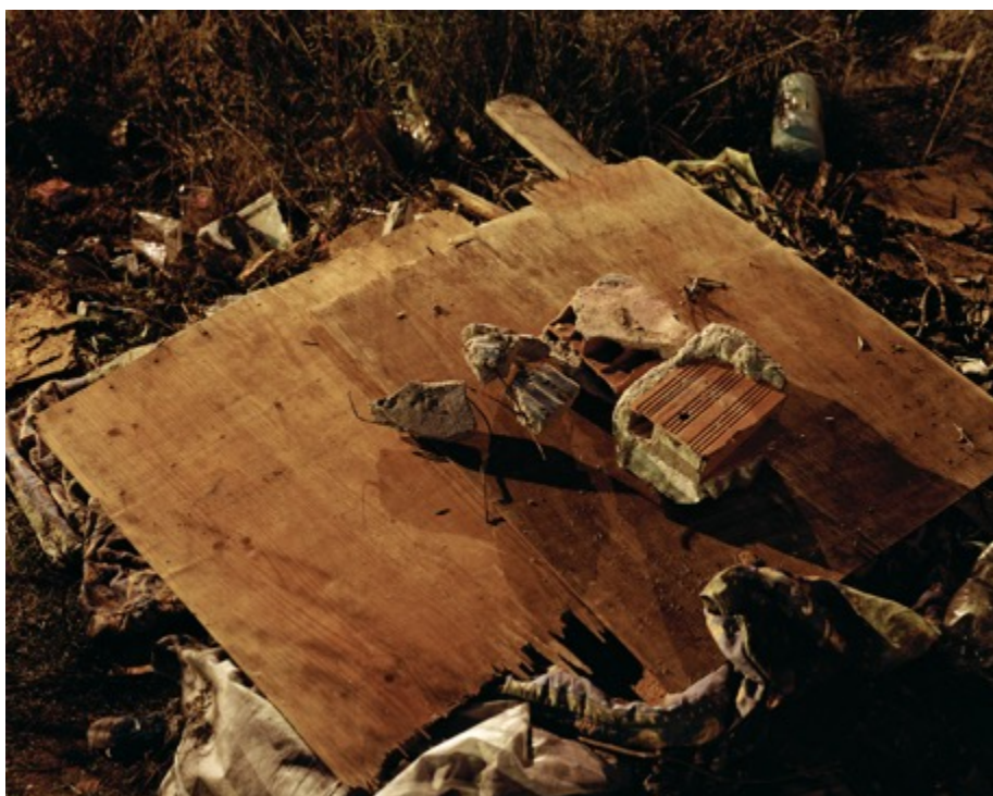
André Cepeda da série “Depois” sem título, Porto, 2015 Impressão jacto tinta em papel fine art Baryta 70X90cm