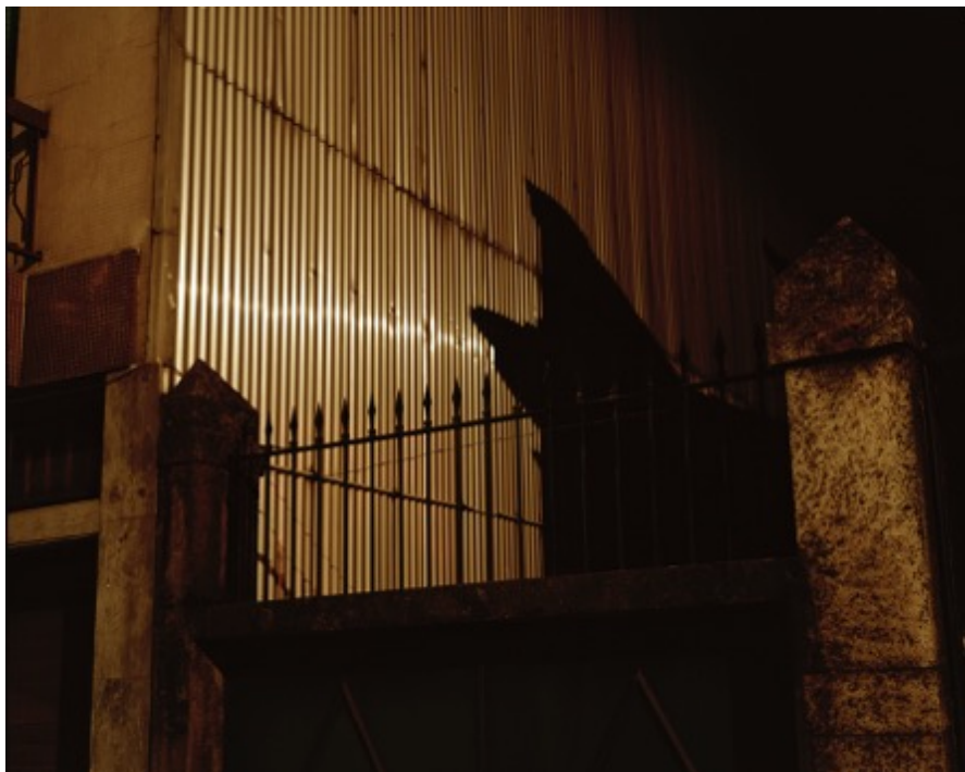
André Cepeda da série “Depois” sem título, Porto, 2015 Impressão jacto tinta em papel fine art Baryta 150X122cm