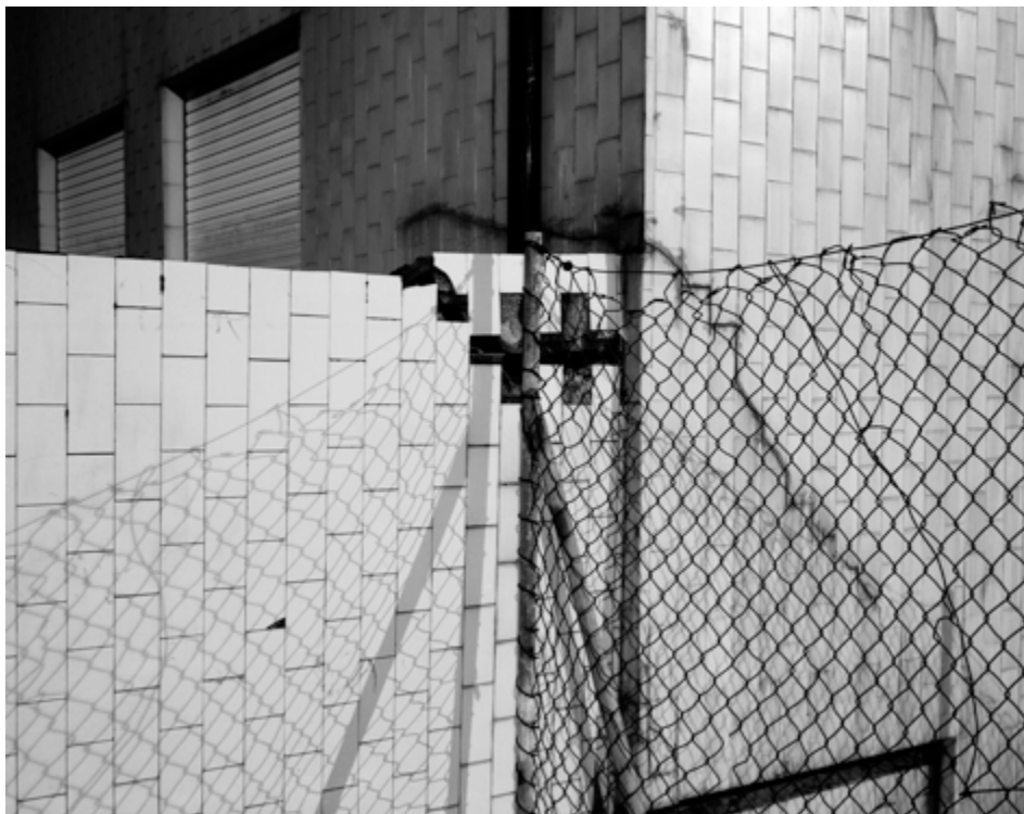
André Cepeda da série “Depois” sem título, Porto, 2015 Impressão jacto tinta em papel fine art 70X90cm