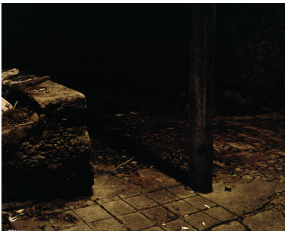
André Cepeda da série “Depois” sem título, Porto, 2015 Impressão jacto tinta em papel fine art Baryta 150X120cm