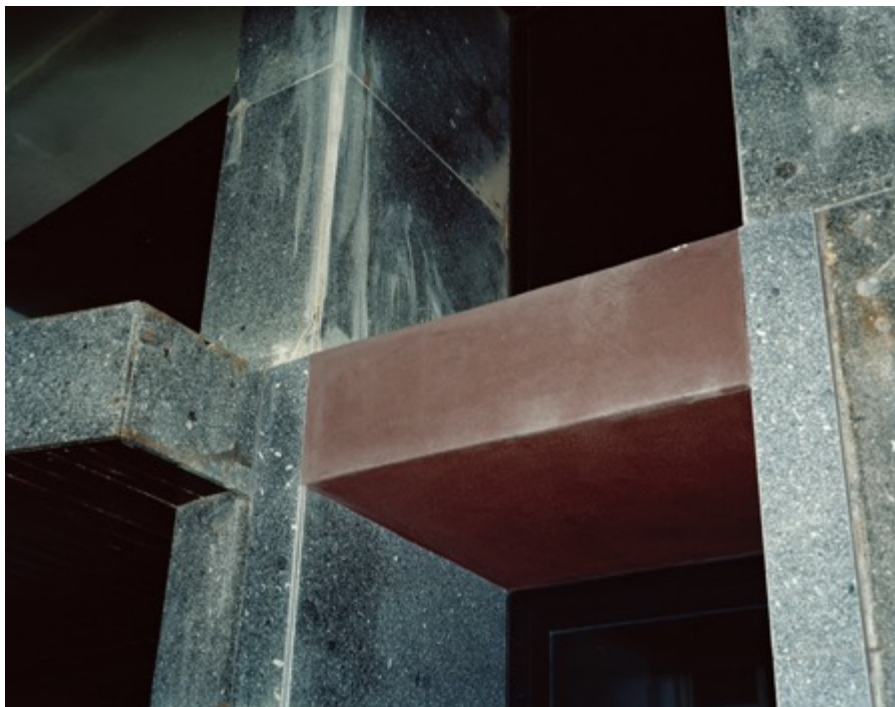
André Cepeda da série "Depois" sem título, Porto, 2015 Impressão jacto tinta em papel fine art Baryta 150X122cm