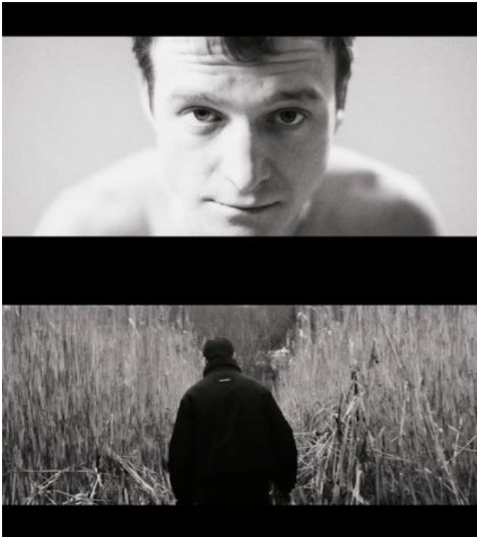
Extinção , HD video, 2:39, P/B, Dolby 5.1 sound, 80', Germany – Portugal, stills

O mais recente filme de Salomé Lamas, Extinção aborda a problemática das fronteiras na atual Rússia e o latente conflito que algumas destas regiões mantêm, sob o peso da história da ex-URSS. O filme decorre na região da Transnístria, um dos países mais pobres da Europa. Através de um elaborado mosaico de elementos ficcionais e reais, lidos por Kolya, é revelada a "guerra surda" que o regime autocrático de Putin tem implementado na região, sob a estratégia da "guerra sem guerra" e da "ocupação sem ocupação". Um documento sobre a construção da identidade coletiva e o confronto com a crescente vaga de "nacionalismos" internacionais.