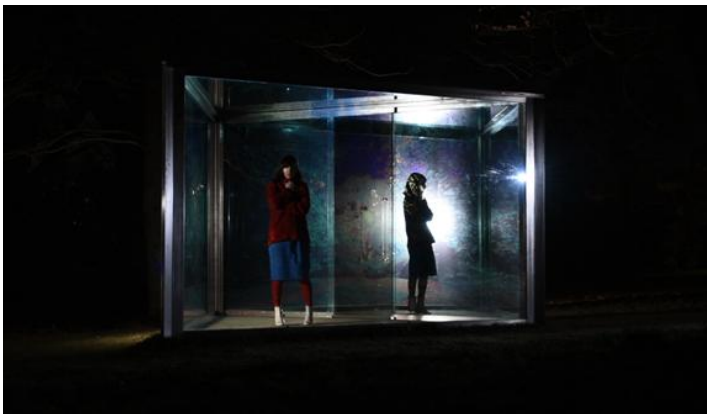
Double Exposure, 2017. Vídeo HD-PAL, Cor, Som, 8', (still)